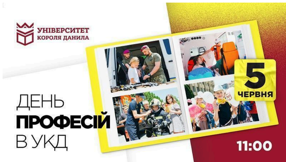
Фото 1. Афіша заходу до Дня захисту дітей. 2024

Фото подаються з нумерацією, назвою та описом, наприклад: