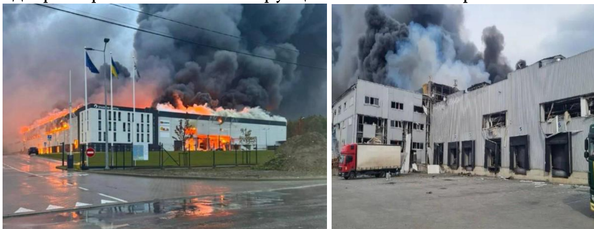
Рис. 2. Знищення ракетними обстрілами індустріального парку у Львові та складу приміщень у Дніпрі

У пристосованих під укриття приміщеннях потрібно мати два входи на кожних 150 осіб. Інші дверні отвори потрібно закладати камінням або засипати ґрунтом. При вході в заглиблені приміщення над вхідними дверима влаштовується залізобетонна плита, яка забезпечить вільне відкриття дверей при обваленні конструкцій наземних поверхів.