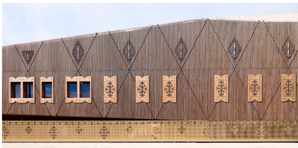
Рис. 1. Міжкомунальний шкільний комплекс зі спортивним залом, центром дозвілля та рестораном у місті Сен-Дені, у Франції [5]

Застосування дерева для створення пластики фасаду дозволяє надати будівлі унікального вигляду. Інтерпретація й переосмислення традиційних структур та орнаментів надає спорудам локальних особливостей. Така ситуація може сприяти відродженню місцевих архітектурних шкіл, ремесел та технологій.