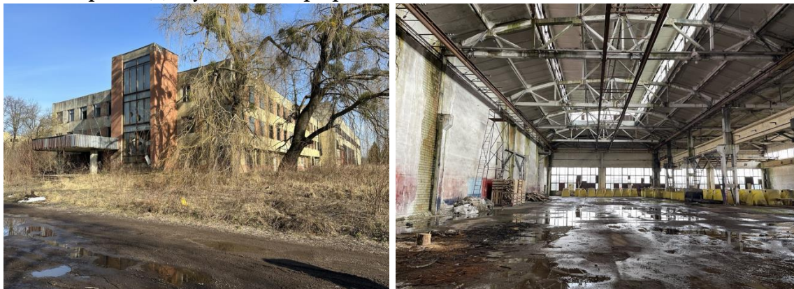
Рис. 1. Стан будівлі на 2023 рік. Вигляд ззовні та зсередини

грибкового впливу. Більшість вікон була пошкоджена. Плоский дах спричинив замокання верхньої частини стін та проникнення вологи всередину будівлі. На покрівлі даху також проріс самосів.