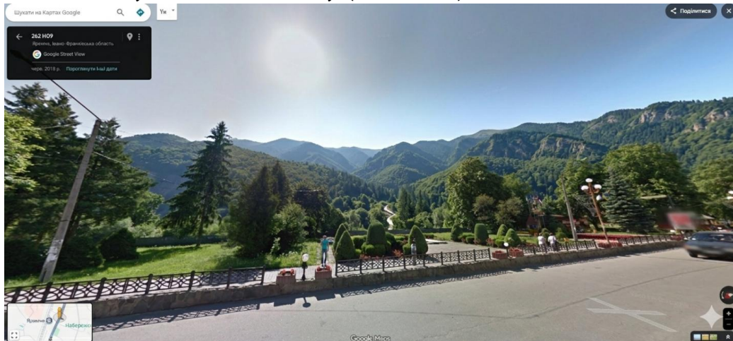
Рис. 1. Фоновий стан ландшафту: експозиція схилів та природних домінант