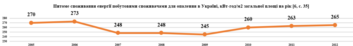
Рис. 2. Питоме споживання енергії побутовими споживачами для опалення в Україні, кВт-год/м 2 загальної площі на рік

З огляду на попередньо вказане, варто зазначити, що на сектор житлових будівель припадає близько 33,2 % кінцевого споживання енергії в Україні, поступаючись промислового сектору (34,0 %) (Додаток 2 до Довгострокової стратегії термомодернізації будівель на період до 2050 року) (Рис. 2) [5].