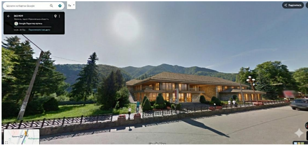
Рис. 3. Формування архітектурного об'єму з дотриманням принципу «незаступлення» природного горизонту

Візуалізація за допомогою ШІ підтверджує: типова високощільна забудова руйнує композиційну структуру поселення. Формальне дотримання ДБН не гарантує збереження ідентичності ландшафту.