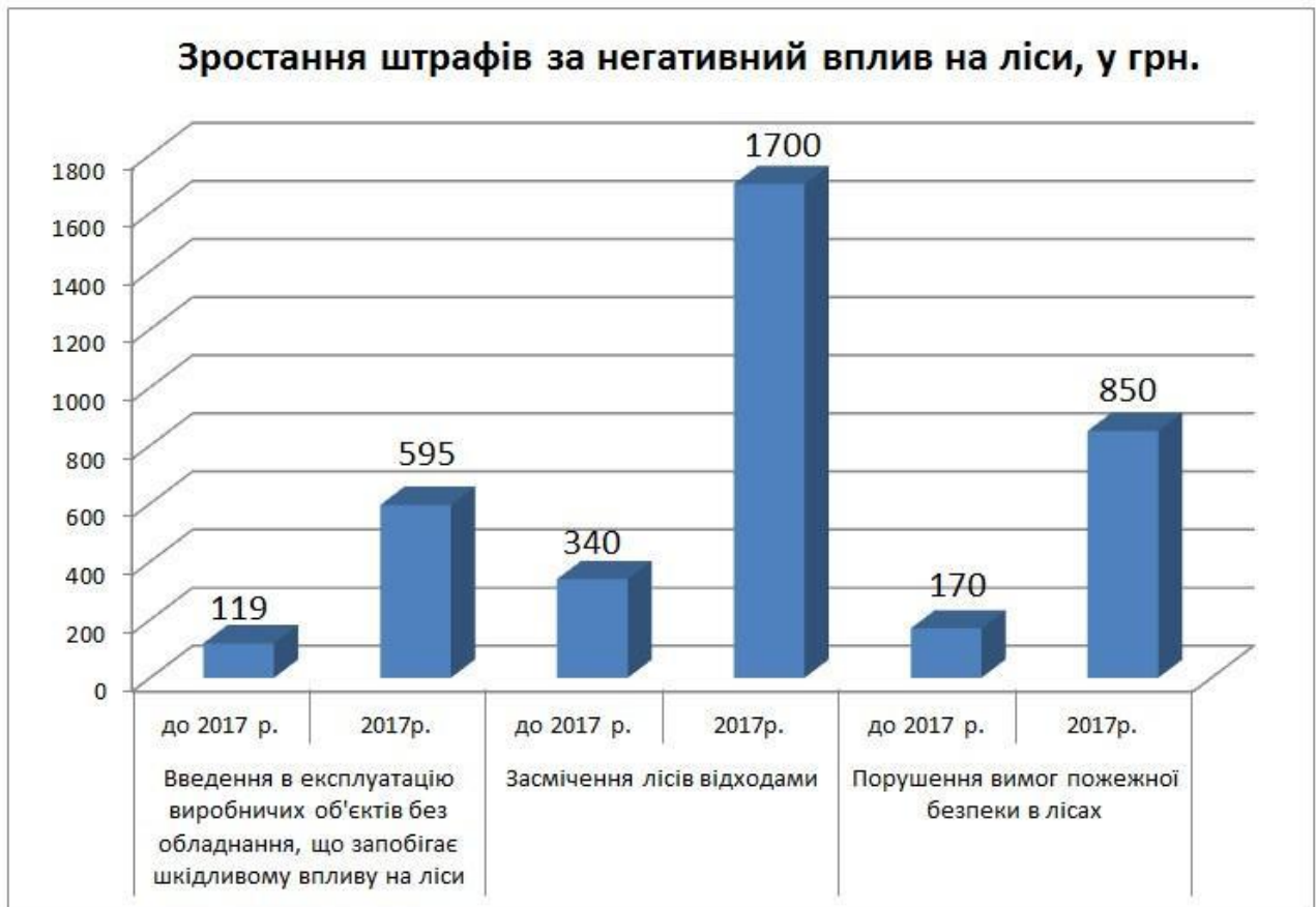
Рисунок 2.3 Застосування цивільно-правової відповідальності за шкоду завдану довкіллю в зв'язку із порушенням норм лісокористування