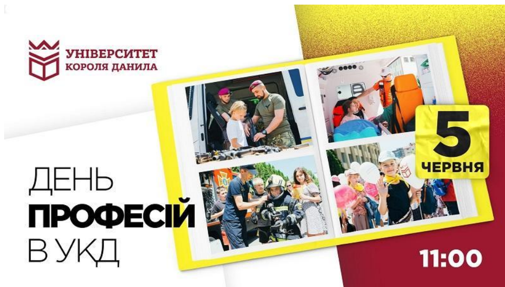
Фото 1. Афіша заходу до Дня захисту дітей. 2024

Фото подаються з нумерацією, назвою та описом, наприклад: