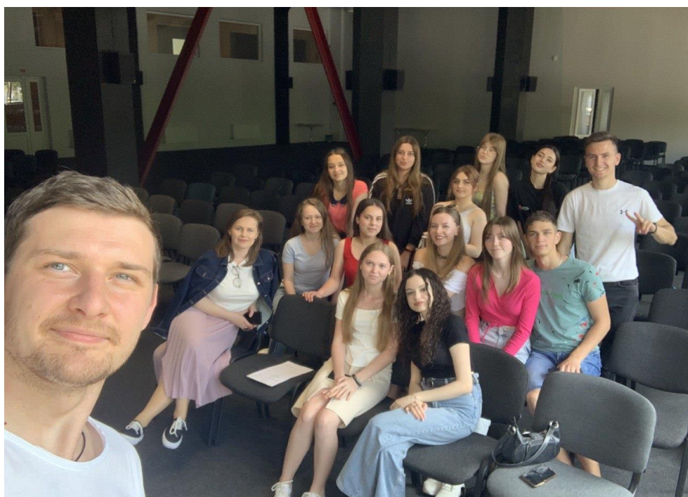
Фото 2. Ознайомчі збори, інструктаж проходження практикуму. УКД. 2023