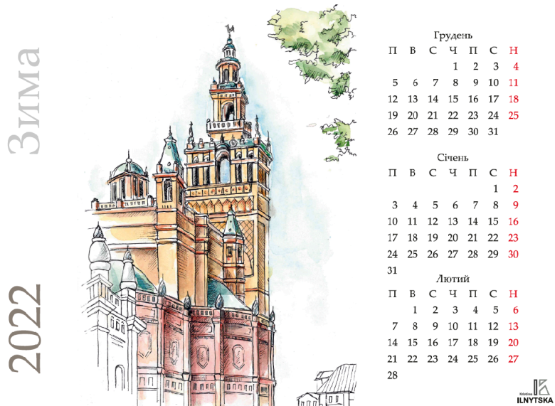
Дизайн-макет сторінки перекидного календаря