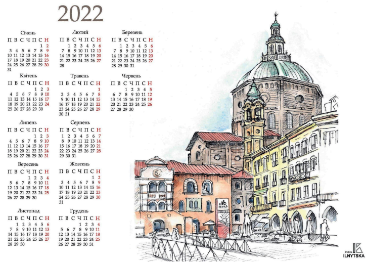
Дизайн-макет плакатного календаря