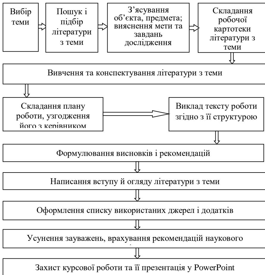
Рис. 3.1. Алгоритм виконання курсової роботи

Раціональніше організувати виконання курсової роботи, правильно розподілити та спланувати його, ґрунтовно та своєчасно розробити вибрану тему допоможе алгоритм виконання курсової роботи (рис. 3.1).