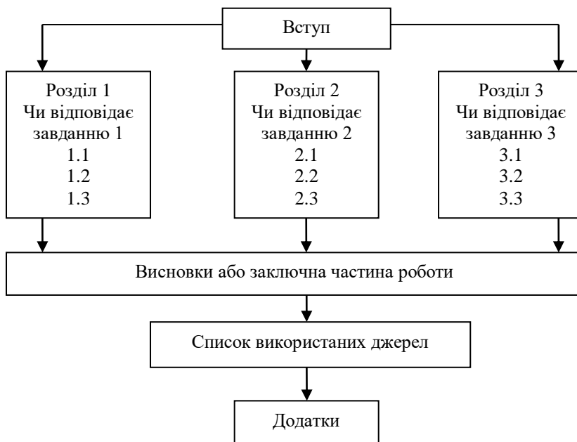
Рис. 3.3. Структура курсової роботи

Формування тексту курсової роботи відбувається шляхом систематизації й обробки зібраних матеріалів із кожної позиції плану. Кожен розділ висвітлює самостійне питання, а підрозділ окрему частину цього питання. Тема має бути розкрита без пропуску логічних ланок, тому, починаючи працювати над розділом, треба відмітити його основну ідею, а також тези кожного підрозділу. Тези необхідно підтверджувати фактами, думками різних авторів, аналізом конкретного практичного досвіду. Кожен розділ чи підрозділ повинен мати таку схему: короткий вступ, факти та їх опис, проведені дослідження на основі обраного наукового методологічного апарату, підсумки.