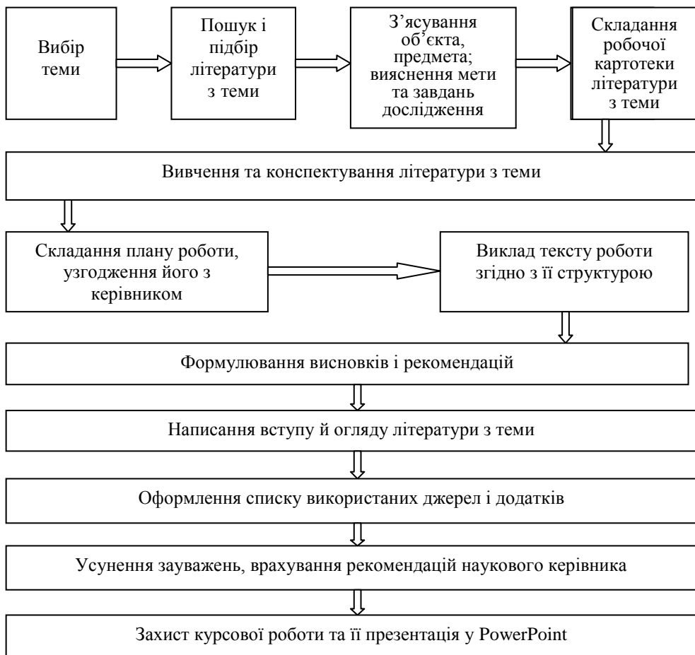
Рис. 3.1. Алгоритм виконання курсової роботи

Після обрання теми й узгодження її з керівником студент починає вивчення літературних джерел. Підбір літератури – це самостійна робота студента, успіх якої залежить від його ініціативності й умінь користуватися каталогами, картотеками бібліотек, бібліографічними довідниками, бібліотечними посібниками, різноманітними списками літератури, виносками та посиланнями в підручниках, монографіях, словниках та ін., покажчиками змісту річних комплектів спеціальних періодичних видань, електронними каталогами бібліотек тощо.